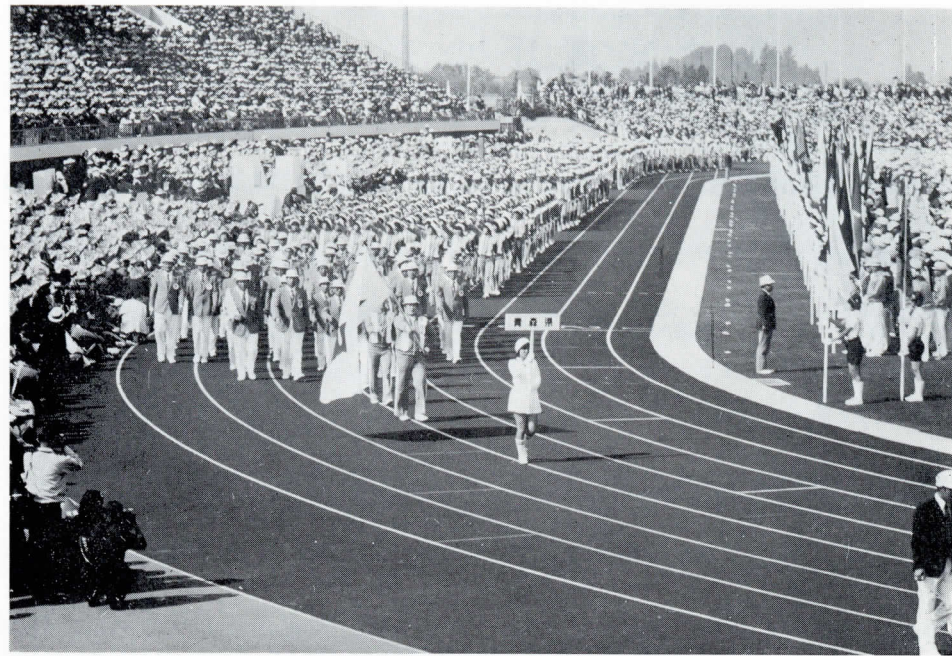
【 堂々行進する 800 人の本県選手団 】