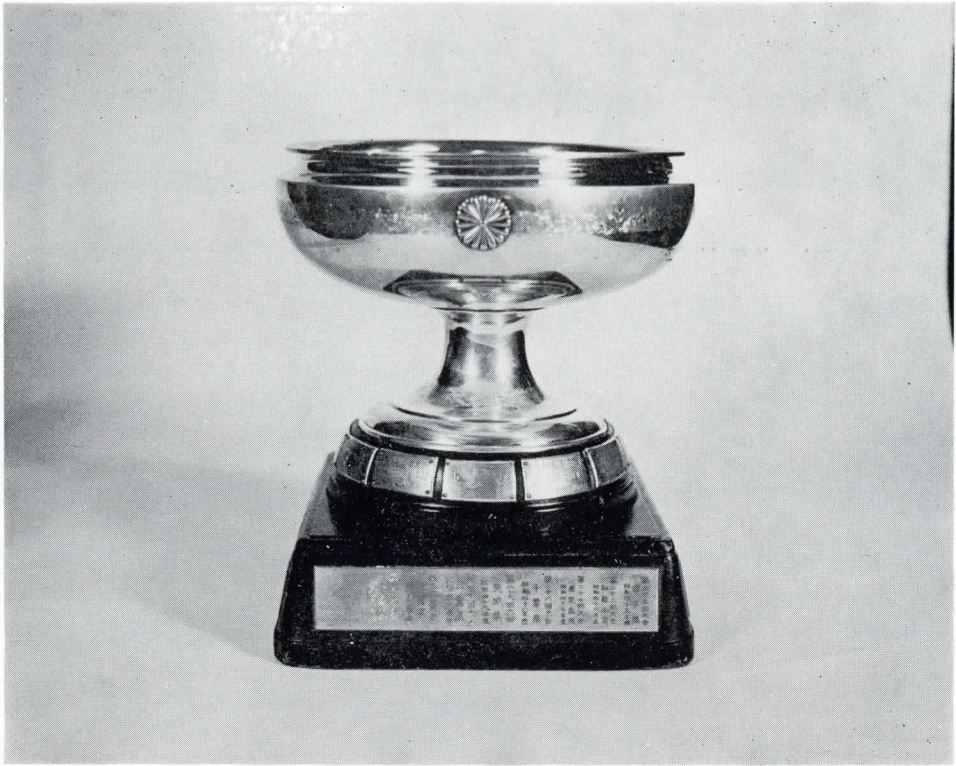
【 天 皇 杯 】